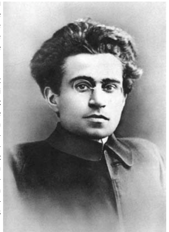
Antonio Gramsci, 1891-1937

Quelles sont les particularités de notre époque à l'échelle du monde et au Québec et quelles sont les solutions envisageables ? Lorsque j'ai écrit mon dernier livre en 2008-2009, la particularité qui m'a sauté aux yeux au moment de la grande crise économique et financière, c'est le type d'organisation économique que nous avons privilégié depuis la fin des années 1970'. Cette époque correspond avec la montée du néolibéralisme. Il s'agit d'un nouveau mode de régulation, d'une nouvelle manière de faire fonctionner l'économie de marché capitaliste. Au Québec cela a eu beaucoup d'effets au cours des dernières années quand on pense au système de santé, au système d'éducation, à la façon de penser l'organisation du travail en société. On note donc cette montée en force d'un nouveau mode de régulation économique, le mode néolibéral qui a fait trois choses très simple : « Privatisation, libéralisation des échanges et déréglementation. » C'est une première chose.